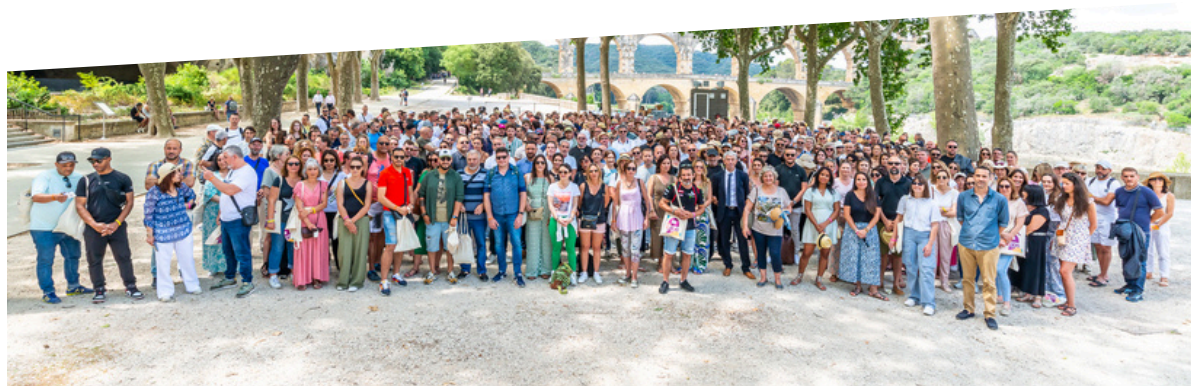
650 collaborateurs engagés au service du logement

Entrer dans sa septième décennie, pour Grand Delta Habitat, ne signifie pas tourner une page. C'est en ouvrir une nouvelle. Avec la même exigence, la même proximité et la même volonté de servir, la Coopérative continue de bâtir des lieux de vie, des parcours résidentiels et des territoires durables.