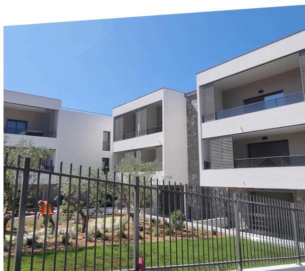
Résidence La Palme à Cannes

Enfin, en 2025, la Coopérative a renforcé son ancrage territorial avec 208 communes partenaires, dont 8 nouvelles communes ayant choisi d'accorder leur confiance à Grand Delta Habitat. À Aubagne, Cannes, Eyragues, Fuveau, Lambesc, Le Puy-Sainte-Réparate, Meyreuil et Vitrolles, ce sont plus de 370 logements qui ont ainsi été développés, illustrant la capacité de la Coopérative à accompagner des territoires aux profils et aux besoins variés.