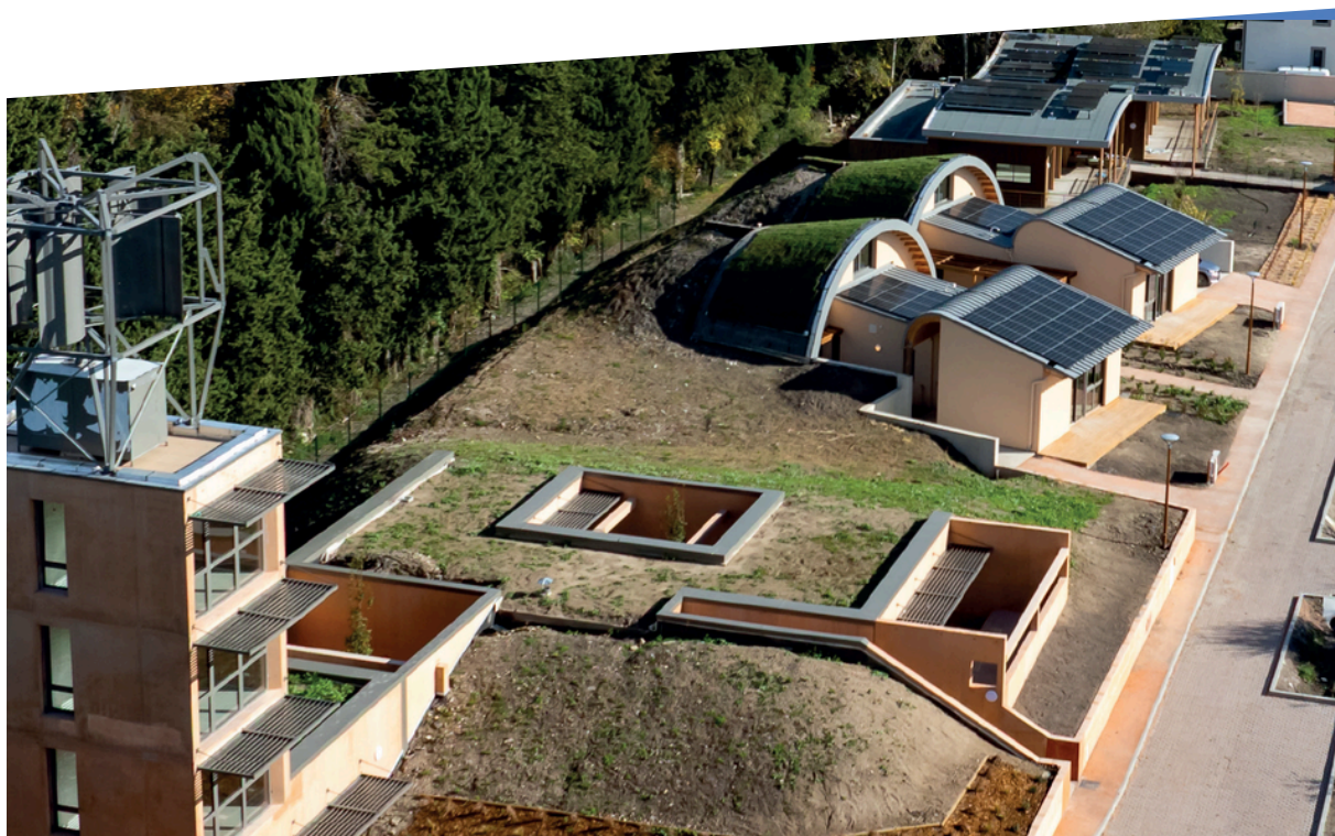
Seul sur Mars® - L'Isle-sur-la-Sorgue (2025)