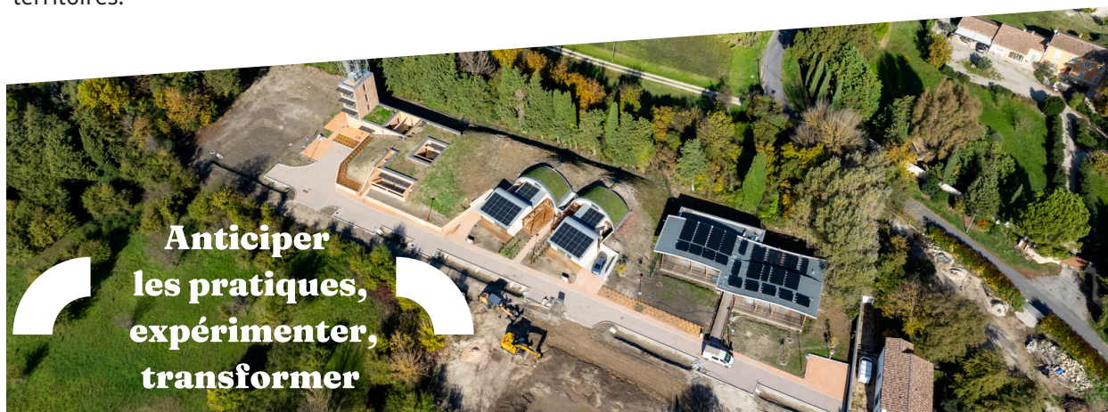
Seul sur Mars® à L'Isle-sur-la-Sorgue

À travers ces réalisations, Grand Delta Habitat affirme une conviction : inventer l'habitat de demain, c'est agir dès aujourd'hui, en expérimentant et en transformant au service des habitants et des territoires.