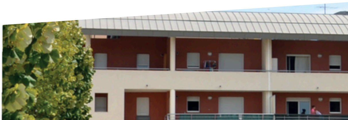
Résidence Le Ronsard - Avignon (2005)