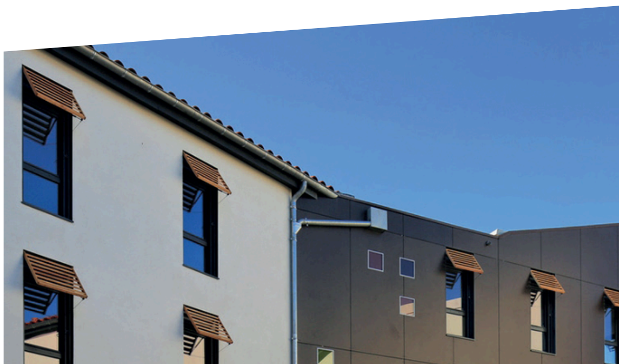
Résidence Sadolet - Carpentras (2012)